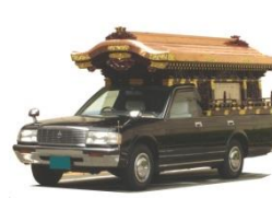
霊柩車・マイクバス