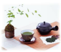
返礼品・礼状 25セット