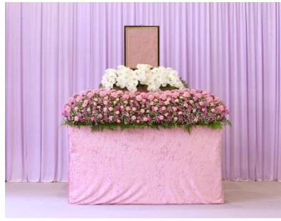
花祭壇 Aタイプの場合