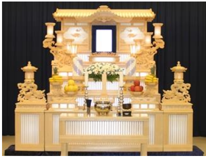
白木五段祭壇の場合