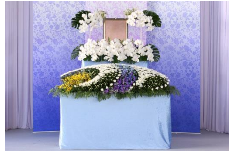
花祭壇 Bタイプの場合