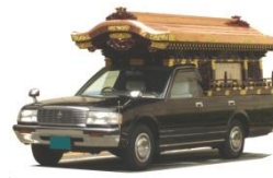
霊柩車・マイクロバス