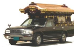
霊柩車・マイクバス